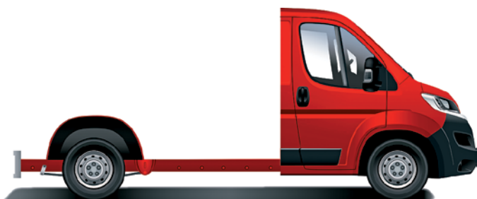
Citroën Jumper Šasi – jednoduchá kabína.