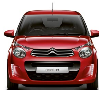
Červená SCARLET (N)