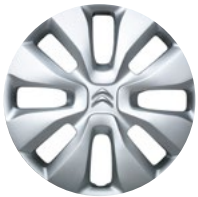
STAR Okrasný kryt 14"