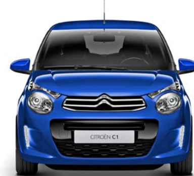
Modrá CALVI (M)