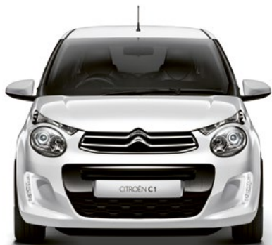
Bielá OURAL (N)