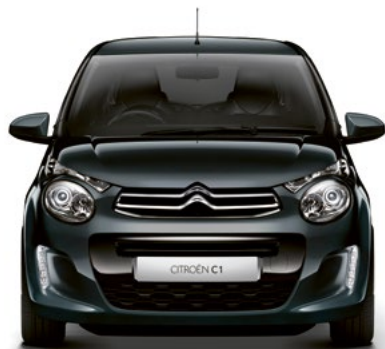
Sivá GALAXITE (M)