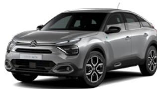
PACK COLOR TEXTURED GREY