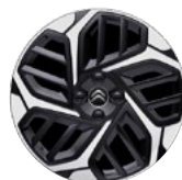
DISK Z LAHKEJ ZLIATINY 18" CAMELIA DIAMANTÉE