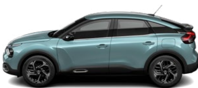
MODRÁ ICELAND (M)