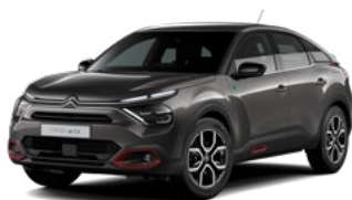
PACK COLOR ANODISED RED