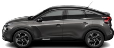
SIVÁ PLATINIUM (M)