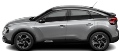
SIVÁ ARTENSE (M)