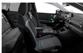
INTERIÉR URBAN GREY (V SÉRII PRE FEEL PACK)