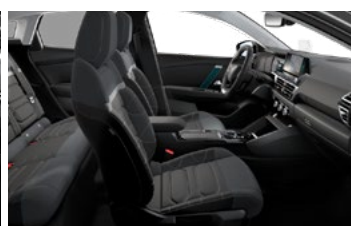
INTERIÉR METROPOLITAN GREY (V SÉRII PRE SHINE)