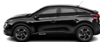
ČIERNÁ OBSIDIEN (M)