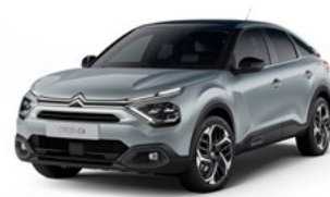
PACK COLOR VAPOR GREY