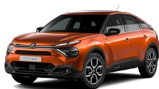
PACK COLOR GLOSSY BLACK