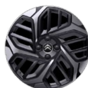
DISK Z LAHKEJ ZLIATINY 18" CAMELIA