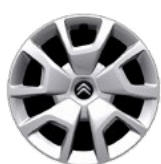
OKRASNÝ KRYT 16" SPRING