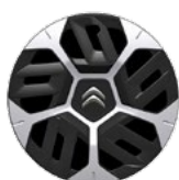
OKRASNÝ KRYT 18" AEROTHECH