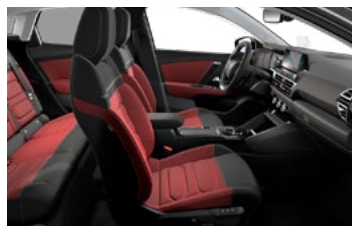
INTERIÉR HYPE RED