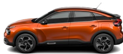
HNEDÁ CAMEL (M)