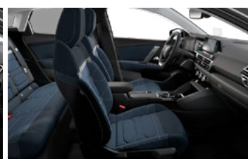
INTERIÉR METROPOLITAN BLUE