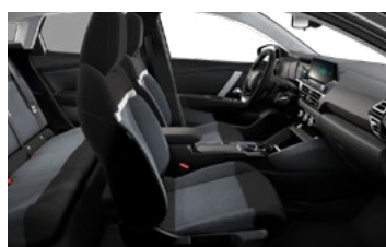
ŠTANDARDNÝ INTERIÉR (PRE LIVE PACK A FEEL)