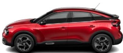
ČERVENÁ ELIXIR (P)

(M) – metalická farba karosérie, (P) – perletová farba