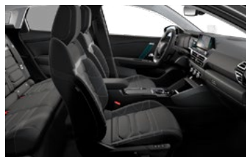
INTERIÉR HYPE BLACK