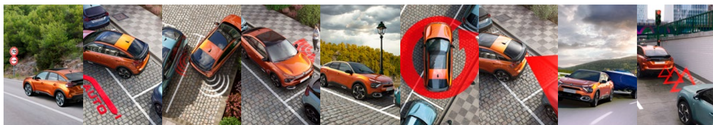
ČÍTANIE DOPRAVNÝCH ZNACIEK A RÝCHLOSTNÝCH OBMEDZENÍ