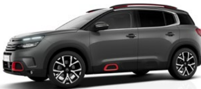
Sivá Platinum (M)