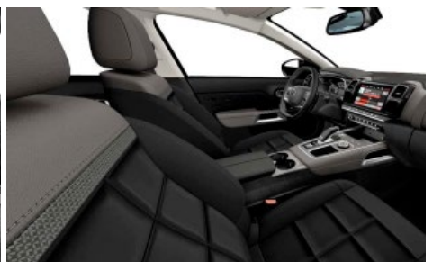
Mix koža NAPPA čierna – látka (TEP) sivá / interiér HYPE čierny