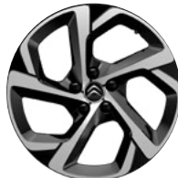
Disk z ľahkej zliatiny SWIRL diamantée, 18"