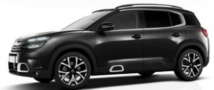
Čierna Perla Nera (M)