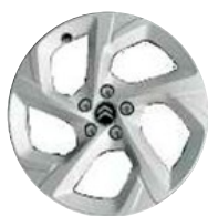
Disk z ľahkej zliatiny SWIRL, 18"