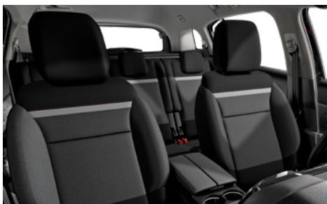
Látka SILICA sivá (v sérii pre FEEL)