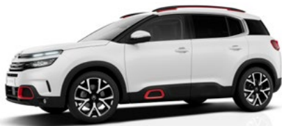
Biele Nacré (P)