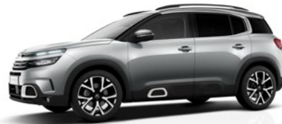
Sivá Artense (M)