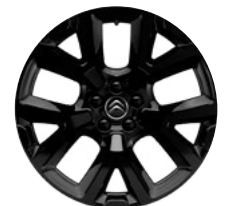
Disk z ľahkej zliatiny ART ČIERNY, 19"

• Štandardná výbava / - nedá sa objednať / (1) - Šírka vozidla, šírka vozidla so sklopenými spätnými zrkadlami; (2) - S pozdĺžnymi tyčami; (3) - Rezervné koleso je potrebné objednať ako príslušenstvo. Cena rezervného kolesa je orientačná a môže sa meniť v závislosti od objednaných dielov k samotnému rezervnému kolesu. Presný rozpis dielov dodávaných s rezervným kolesom a iných detailov Vám poskytne predajca. Pre viac informácií o obsahu servisného kontraktu, ako aj o možnostiach inej kombinácie dĺžky kontraktu a najazdených kilometrov, kontaktujte ktoréhokoľvek predajcu CITROËN, alebo kliknite na www.citroen.sk .