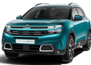
Pack Color White (biela)