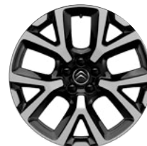
Disk z ľahkej zliatiny ART diamantée, 19"