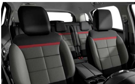
Mix látka s efektom kože (TEP) čierna + látka Stone sivá (v sérii pre FEEL PACK)