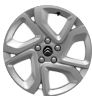
Disk z ľahkej zliatiny ELLIPSE, 17"