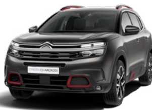
Pack Color Deep Red (červená)