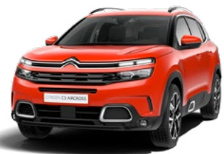
Pack Color Silver (strieborná)