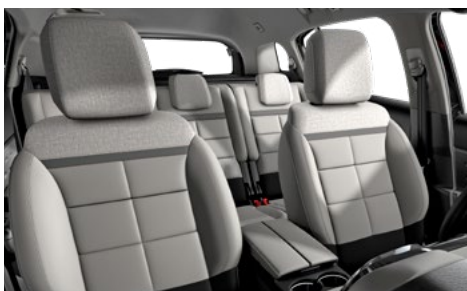
Mix koža GRAINE sivá – sivá látka / METROPOLITAN béžový