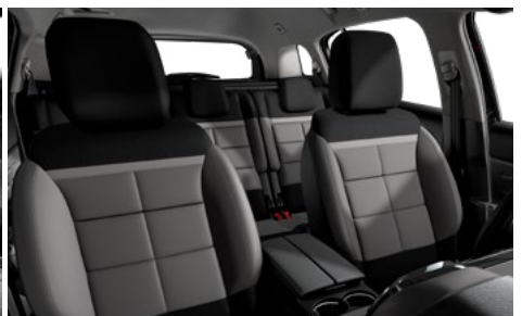
Mix koža GRAINE – grafitová látka / METROPOLITAN sivý