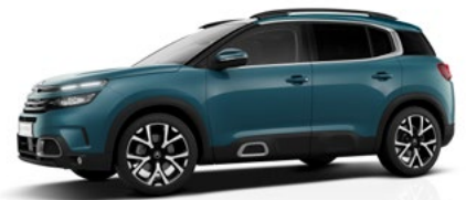
Modrá Tijuca (M)