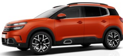
Červená Volcano (M)