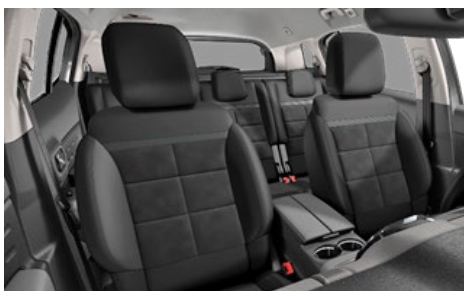
Mix ALCANTARA čierna + látka (TEP) čierna / interiér Urban Black